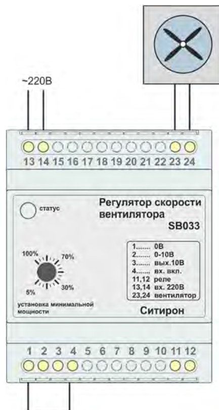
Схема 1 Работа на фиксированной скорости, с обязательным использованием перемычки между контактами 1 и 4

!!!КАТЕГОРИЧЕСКИ ЗАПРЕЩАЕТСЯ ОБЪЕДИНЯТЬ НЕЙТРАЛЬ НА ВХОДЕ И ВЫХОДЕ РЕГУЛЯТОРА